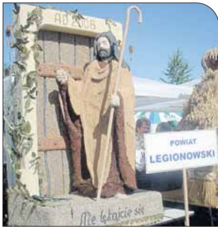
„Otwórzcie drzwi Chrystusowi”