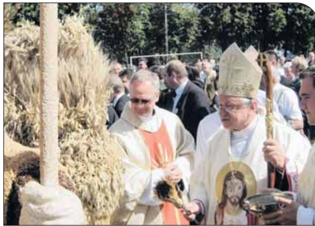
Dożynki w Zwoleniu